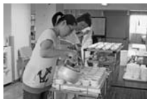
【おやつ準備のお手伝い】