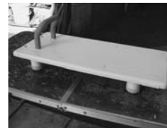
▲バスボード 使用状況： きれいに使用 保管場所：東 ※取り付け可能浴槽外寸 64~75cm