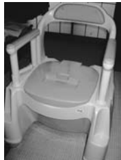
▲ポータブルトイレ 使用状況： ていねいに使用 保管場所：北