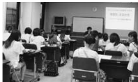
【オリエンテーションの様子】