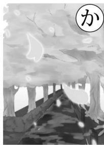
絵札作者: 峰岸りほ (都立第五商業高等学校卒業生)