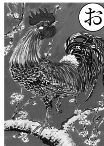
絵札作者: 榊原茂子 (画家)