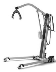
▲介護リフト 使用状況:きれいに使用 保管場所:西 ※スリングシート無 パラマウントベッド製