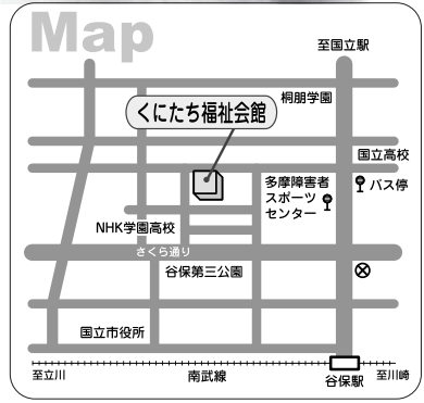
社会福祉協議会の事務所は福祉会館1階です。