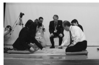
舞台上でのカルタの試戦

参加者の皆さんからは、「こんなに立派な式だとは思わなかった。緊張はしたが嬉しかった。」「カルタをやったら楽しかった。」「絵を描いてくれた方に会えて良かった。」など感想をいただきました。ご協力、ご出席いただいたすべての皆様に感謝いたします。