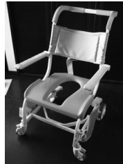
▲シャワーチェア 使用状況:きれいに使用 保管場所:東 TOTO製