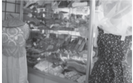
福祉会館内ショーケース

ご家庭で、眠っている毛糸や布、手芸用品などはありませんか。市内の手作りボランティアグループがいた