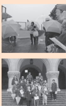
▲前回のボラセンウォークの様子

★問合せ 国立市ボランティアセンター (平日9時～17時) ☎042-575-3223 ☒kfh01416@nifty.com