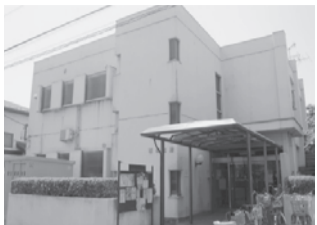
▲お世話になっている西福祉館

今年度は西地域をモデルとして事業に取り組んでいます。西福祉館運営委員のみなさんにご相談させていただきながら、民生・児童委員さん、