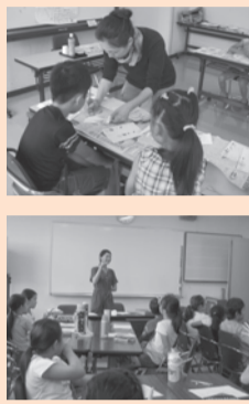
▲ボラセン学校の様子