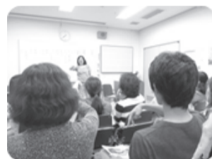
くにたち社協 手話講習会の様子

募金運動は、どなたにもご協力いただける身近な福祉活動のひとつです。みなさまのご理解とご協力のほど、よろしくお願いたします。