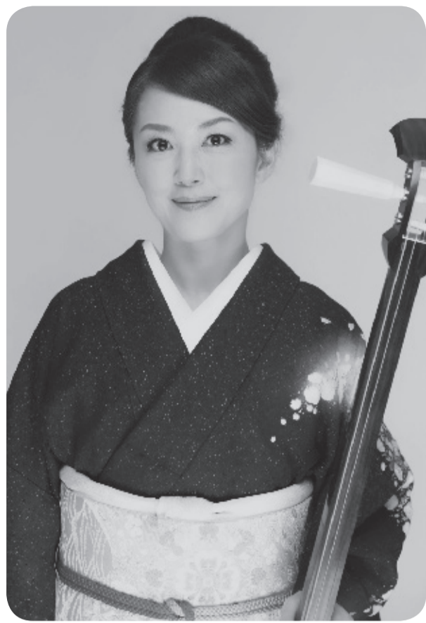
主催：チャリティ公演実行委員会

退任された民生委員・児童委員のみなさまが実行委員となって、今夏、チャリティ公演を企画・開催します。今年、数々の津軽三味線コンクールで優勝をし、今最も注目されている女性津軽三味線奏者のひとり、松橋礼香さんをお迎えし、繊細かつ迫力ある津軽三味線の演奏をみなさまにお届けいただきます。 本公演による純益は、本会の福祉事業のために寄附される予定です。みなさまのご理解、ご協力のほどよろしくお願ひします。 《日時》 7月6日(土) 午後5時30分開場／午後6時00分開演 《会場》 くにたち福祉会館 4階大ホール 《チケット》 1枚 2,000円(全席自由) 販売は5月6日(金)午前9時から開始 くにたち福祉会館社協窓口に ★お問い合わせは、総務企画係へ 042-575-3226 ★松橋礼香さんプロフィール★ 10歳より津軽三味線を始める。 これまで数々の津軽三味線コンクールで優勝。 2009年、津軽三味線木乃下流 礼香会を発足。 2010年より「松橋礼香 津軽三味線ライブ」を継続して開催。そのほかさまざまな公演に出演。今最も注目される女性津軽三味線奏者である。