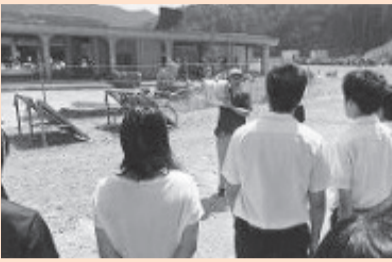
～活動報告～ 「石巻西高校との交流プログラム」復興の現状を自分たちの目で確かめ、被災地の高校生との交流や仮設住宅を訪問し交流してきました。ありがとうございました。(都立第五商業高校 全日制 ボランティア部)

★作品 ボランティア・地域での交流・ふれあいなどをイメージするイラストを絵画、パソコンで作成したもの※写真作品を除く ★資格 市内在住・在学の中学生、または高校生 ★サイズ A4横書き 用紙は国立市ボランティアセンターに用意してあるものを使用して下さい。 ★応募 作品の裏に氏名・学校名・学年・住所・電話番号を記入の上、ボランティアセンターまで持参またはデータの送付。 ★締切 6月10日(金) 17時 ★メール KFH01416@nifty.ne.jp