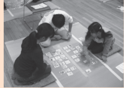
昨年のトーナメントの様子