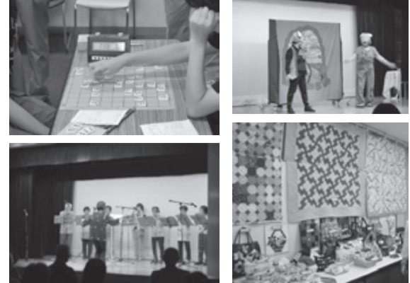
▲多くの方に見ていただける機会です!

毎年多くの方が来場する世代間交流が目的の福祉イベントです。出演・出展・大会参加してみませんか。 ★日時 9月9日(土)・10日(日) ★募集・ステージ(9日) 演奏・合唱・ダンスなど (4階大ホール) ・舞台出演者(9日・10日) カラオケ・民謡など (2階大広間) ・作品出展者(9日・10日) 絵・書・手芸品など (3階会議室など) ・大会出場者 囲碁大会(9月3日) 将棋大会(9日) 小中学生将棋大会(10日) ※大会は応募者が少ない場合中止することがあります。 ・その他 キッズレポーター(9日・10日)