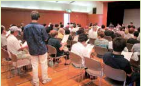
実行委員会の様子

9月8日(土)、9日(日)に、くになち福祉会館全館を使って、世代間交流のイベントを開催します。このイベントは自治会、老人会、民生委員、福祉施設、団体など、地域の方々の実行委員となり、お祭りを盛り上げていきます。実行委員は6