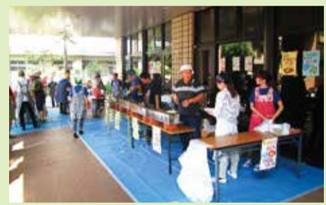
模擬店準備の様子

方々が実行委員として活躍していただきます。ぜひ皆様のお力を貸してください。詳しくは左記までお問い合わせください。 問合せ 総務課総務企画係 ☎042-1575-3221