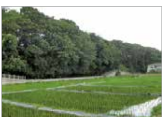
下歩きの時には緑の田んぼも、まち歩きの際はどんな景色かな

応募締切 9月26日(水)午後5時 企画運営 国立市ボランティアセンター 運営委員会